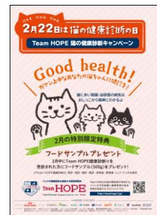
キャンペーンポスター

キャンペーン実施病院一覧や、猫の健康診断解説動画（病院への連れて行き方や健診の流れを紹介）猫に関する健康管理についての情報もご覧いただけます。